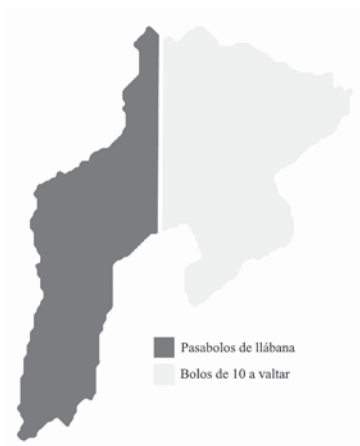
Imaxe 1: Distribución bolística en Grau según Fernández de Gamboa (1978).

La primera d'illas (Fernández de Gamboa 1978), que fai una representación aproximada de los xuegos de bolos nel norte de la Península Ibérica, pon una llinde norte-sur que pasa pol centro-occidente asturianu, dexando pal oeste los xuegos de pasabolu en solera ya pal este los xuegos de 10 bolos que consisten en valtallos. Taríamos falando, pal casu asturianu ya moscón, d'una llinde ente'l batiente (que ya un xuegu de pasabolu, aunque non siempre en solera) ya la cuadrada (un xuegu de 10 bolos au se valta pero nel que tamién hai outras aiciones puntuables que dependen de la bola). Aunque ya una aproximación, como'l mesmu autor sostién (igual n'escala cartográfica qu'en tipificación de los xuegos, que ya mui superficial), nun ya menos verdá qu'una realidá de naturaleza complexa quedaba a señalada – polo menos en parte – garrando ensin duda las coordenadas del conceyu Grau.