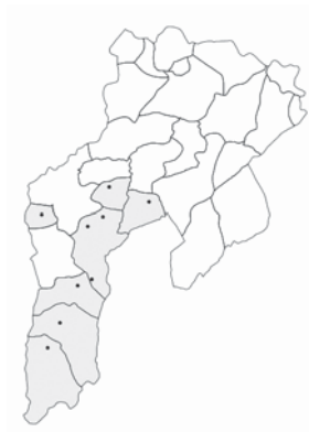
Imaxe 6: Territoriu de cuadrada con birle. Los puntos corresponden a los llugares au apaez el xuegu ya las parroquias que tán escurecidas son las que lu tienen como espresión bolística corriente.

4.- El batiente ya esclusivu nas parroquias de Peñaflor ya Castañéu, en tola vallada del ríu Moutas, na parte media ya baxa del valle del ríu Pequeñu ya en tol territoriu al oeste del ríu Cubia desque se-y amiesta'l Pequeñu. Comparte xeografía cola cuadrada nos tramos medios-baxos de los ríos Sama ya Las Varas ya nel fondu'l valle'l Cubia dende Grau hasta Bárzana. Nas partes altas de Salcéu llega a entrar en contautu tamién col birle ya cola cuadrada con birle.