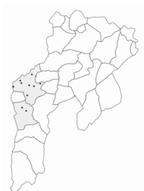
Imaxe 4: Territoriu de birle. Los puntos corresponden a los llugares au apaez el xuegu ya las parroquias que tán escurecidas son las que lu tienen como espresión bolística corriente.

2.- La cuadrada paez tener llandada la sou estensión pol ríu Cubia, nun apaez el xuegu ya esclusivu nas parroquias de Cuaya, Rodiles, Sama ya San Adrianu, ya tamién nos llugares altos de la de Rañeces. El restu'l territoriu compártelu, al norte col batiente, ya pal suroccidente colas trés: birle, cuadrada con birle ya batiente.