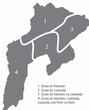
Imaxe 8: Zonificación del conceyu Grau según los sous xuegos de bolos.

Esas cuatro zonas bolísticas que podemos faer nel conceyu tienen continuidá colos conceyos llindeiros. La zona esclusiva de cuadrada seguiría pal sureste a los conceyos de Santu Adrianu, Proaza, Tameza ya Teberga. La zona esclusiva de batiente allárgase al norte ya pal noroeste entrando a Les Regueres, Candamu, Salas ya la Ría Miranda (Balmonte). La zona na qu'apaecen cuadrada ya batiente, sigue al este ya'l noreste pasando a Les Regueres ya Uviéu. La zona más amestada tien continuidá constatada en Balmonte, au tienen más fuercia los xuegos de birle.