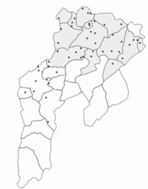
Imaxe 7: Territoriu de batiente. Los puntos corresponden a los llugares au apaez el xuegu ya las parroquias que tán escurecidas son las que lu tienen como espresión bolística corriente.