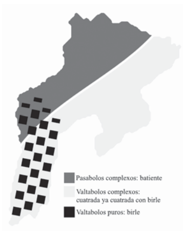
Imaxe 3: Distribución bolística en Grau según Suari (2014).

mayores novedades qu'introduz esti mapa son el repartu del conceyu en tres families de xuegu (aunque en realidá son cuatro las modalidades porque dous d'illas son de la mesma familia) ya la representación espresa de la convivencia histórica de dalgunas d'illas.