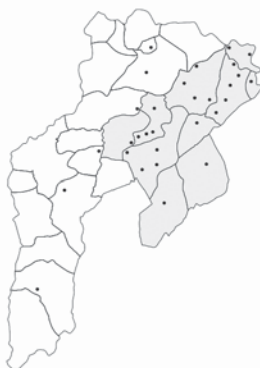
Imaxe 5: Territoriu de cuadrada. Los puntos correspuenden a los llugares au apaez el xuegu ya las parroquias que tán escurecidas son las que lu tienen como espresión bolística corriente.

3.- La cuadrada con birle apaez na zona'l conceyu au las cuatro variantes bolísticas llegan a xuntase. Pudiemos rexistralla en llugares del cursu mediu del rú CUBIA asitiaos a mediana altitú ya tamién en Santianes ya en Vigaña, que ya'l pueblu que fiende la continuidá del birle nas tierras altas del rú Pequeñu.