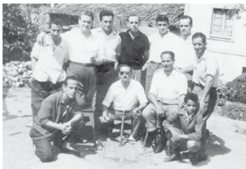
Semeya de xugadores de llave en 1956