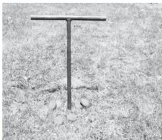
Semeya de llave de «T», del ferrocarril, coleición de G. Ruiz Alonso

Lo que de primeres yera la maniya d'una llave industrial fixa, pasó a ser una aleta, dempués dos aletes y móviles, y más tarde llega a nós con tres aletes móviles; y lo mesmo asocedió colos oxetos de tiru, primero piedras, dempués tejos, llueu cachos de fierro o fiches pequeños y poco pesaes en númberu de 4, más tarde fiches de fierro acerao más grandes y más pesaes en númberu de 6; d'igual manera evolucionó la reglamentación del xuegu, la técnica de los xugadores, y too diba perfilándose, uno llevaba a lo otro, según técnica, pesos de les fiches, númberu d'aletes, etc., diba reglamentándose la cancha, les midíes de tiru, el caxón, les normes de xuegu... hasta llegar a los nuestros díes como un xuegu bien reglamentáu o deporte.